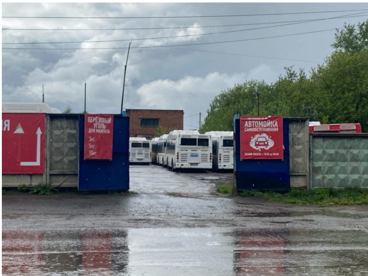
Рисунок 2 - Производственная база пермских автобусов