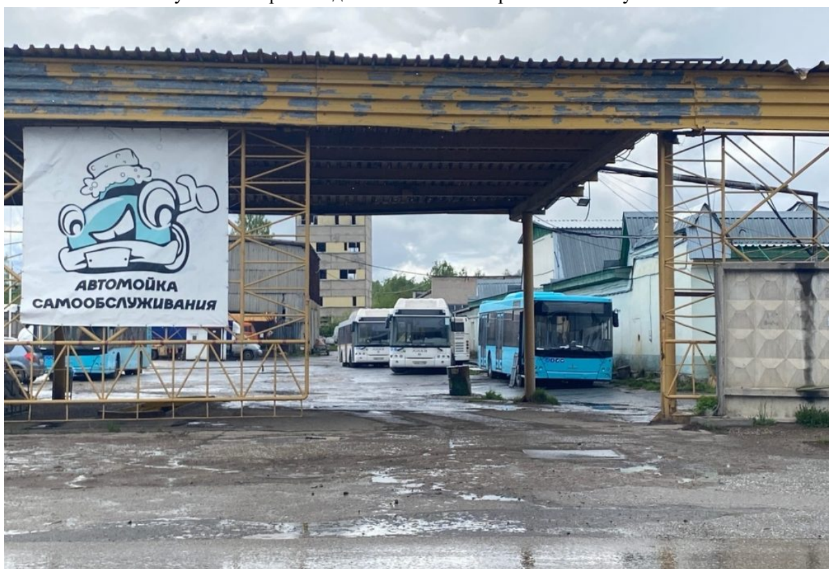
Рисунок 3 - Производственная база пермских автобусов

Общий объем транспортной работы на пять лет составляет 129 673 279 км. Объем финансирования на пять лет для 18 маршрутов составляет 16,471 млрд руб. Средняя цена одного километра транспортной работы составляет 127,02 руб.